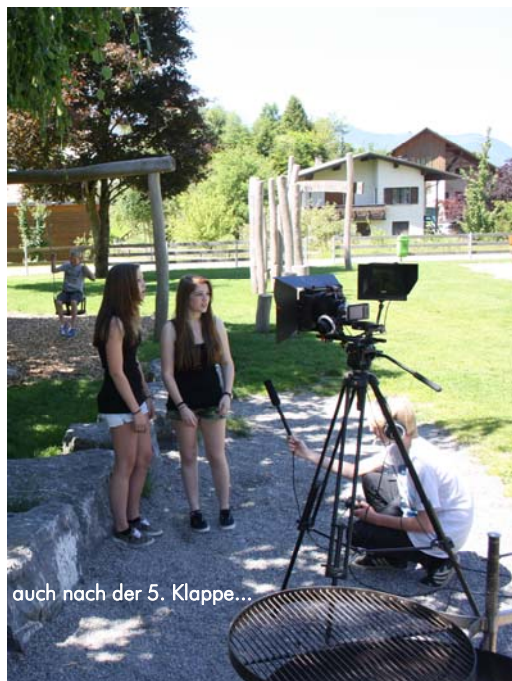
auch nach der 5. Kloppe...