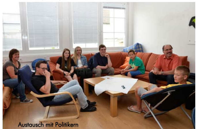
Austausch mit Politikern

Alle Filme wurden am 27.06.2014 in den Räumlichkeiten der JugendKulturArbeit Walgau in Nenzing präsentiert. Nach der Präsentation waren die Bürgermeister und Gemeindevertreter eingeladen, gemeinsam mit den Jugendlichen die Themen zu erörtern, die in den Filmen aufgezeigt wurden.