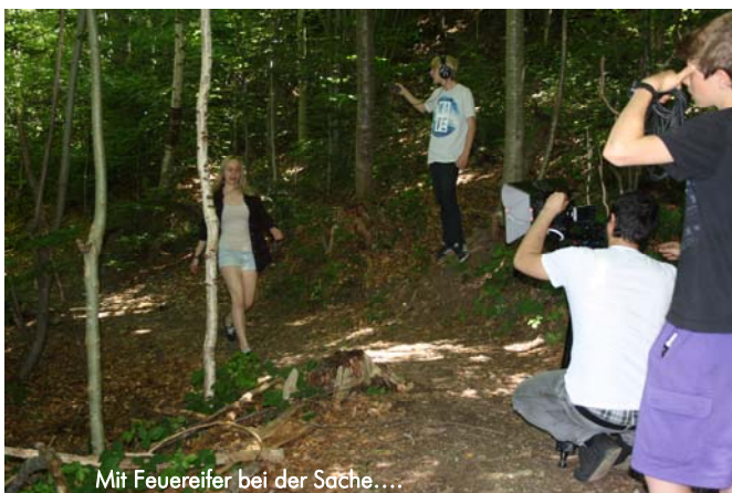
Mit Feuertreifer bei der Sache....

Die Schnifner Jugendlichen wählten den Sportplatz, das Blockhüsle, den Fallensee und natürlich den Jugendraum als Locations für ihren Film.