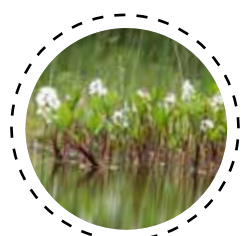
NATURVIELFALT HAUTNAH ERLEBEN 14.06.2026