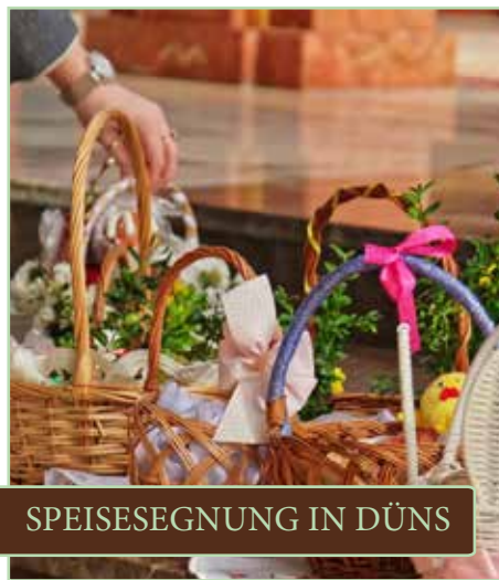
SPEISESEGNUNG IN DÜNS

Nun steht einer zwar anstren- genden, doch lohnenswerten Bike-Tour von Schnifis über den Hochwald und zurück über den Hensler nichts mehr im Weg.