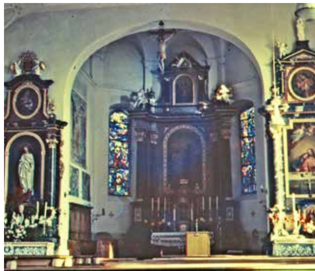
Foto: Schnifner Pfarrkirche in den 60er-Jahren