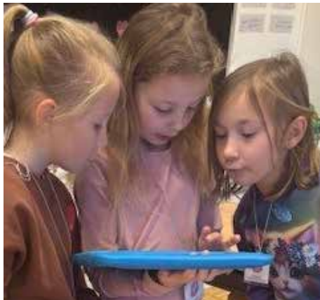
MINT TAG IN DER VOLKSSCHULE

Heute möchten wir Ihnen einen kleinen Einblick in eines unserer wöchentlichen Highlights geben: