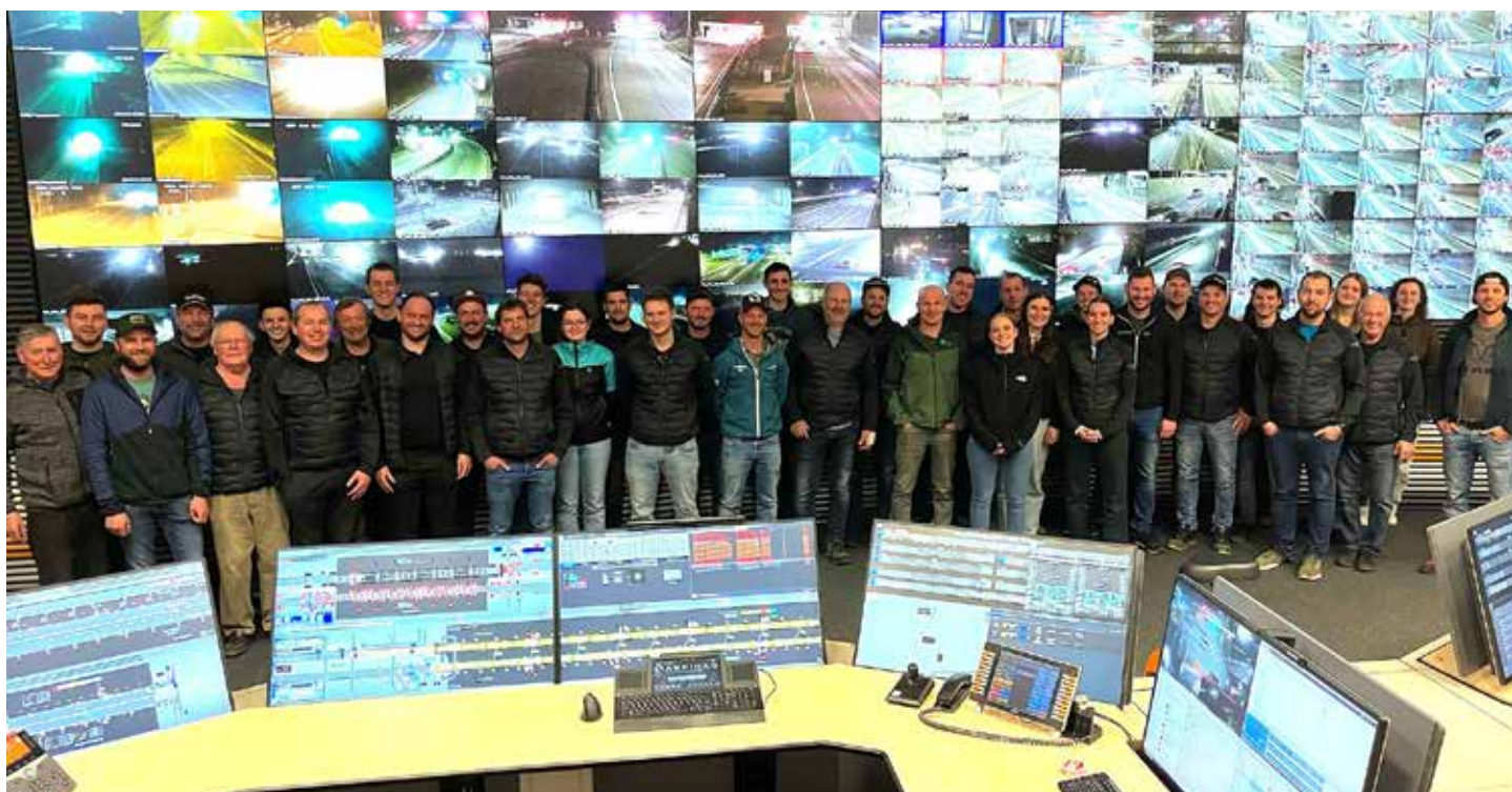
Unser Mannschaftsstand per 01.01.2026: 51 Mann und 9 Frauen aktiv, ein Mann passiv, zwei Kameraden als Ehrenmitglied und ein Ehrenkommandant - insgesamt 63 Mitglieder.

Wir freuen uns über viele Zuschauer und Unterstützung bei den Bewerben!