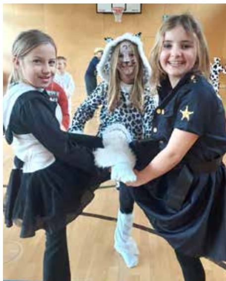
FASCHING IN DER VOLKSSCHULE

Besonders beeindruckend ist für uns dabei die Ausdauer und Neugierde, mit der selbst die Kleinsten die Welt unter die Lupe nehmen.