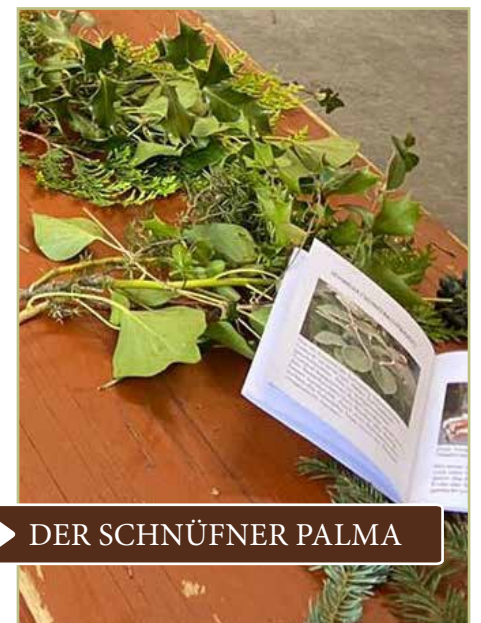
DER SCHNÜFNER PALMA

Generationen und hält eine wertvolle Tradition in unserem Dorf lebendig.